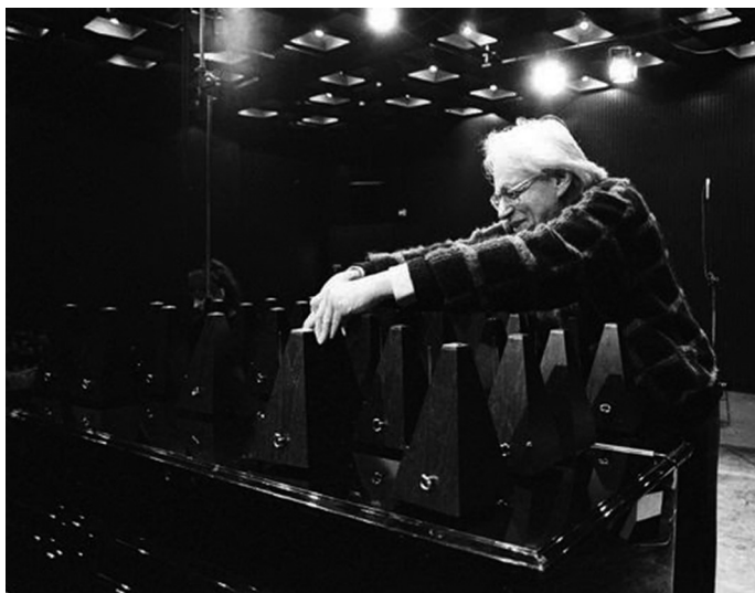
György Ligeti preparando una interpretación de su Poema Sinfónico para 100 metrónomos .

— Es doctor en Ciencias de la Música, miembro del Laboratoire de Musicologie Comparée et Anthropologie de la Musique de la Universidad de Montreal (Canadá) y de la Association Polyphonies Vivants del CNRS de París. Asesor científico y artístico de la Fundación Carl Orff de Múnich y colaborador del Teatro Real de Madrid. Profesor asociado en la UCM y en cursos internacionales de música, ha publicado artículos, libros, materiales educativos, documentos de audio y un film. En la actualidad realiza un trabajo experimental sobre polifonías vocales en Georgia.