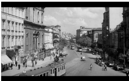
Fig.1. Tomas de Varsovia en Pie

Que la combinación de sonidos de lugar a un encuentro importante para la historia, es algo que está presente en el cine de Roman Polanski antes incluso de dirigir largometrajes. Concretamente en el cortometraje Cuando los ángeles caen ( Gdy spadają anioły , 1959), una combinación de los sonidos de las gotas de agua y el sonido de una flauta transportan, a modo de flashback , a una anciana mendiga desde el escenario decadente de su presente (un baño público que usa como vivienda) al escenario natural de su juventud, cuando conoció al soldado que acabaría siendo padre de sus hijos.