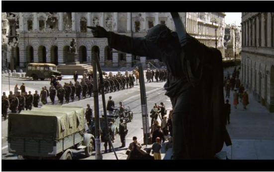
Fig.3: Imagen del Nazareno 1