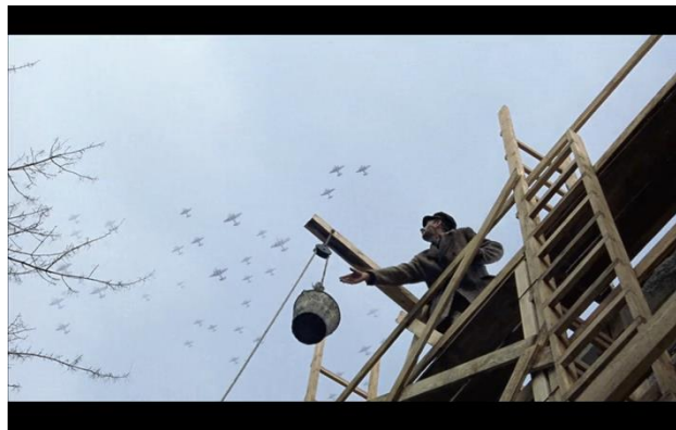
Fig.12: Fase 5 de claustrofobia visual. El cielo flanqueado por los aviones.

construir un enorme fuerte encima de los escombros de lo que quedó del Ghetto tras el traslado de la mayor parte de las familias hacia campos de concentración o cámaras de gas. Pero no solo por la superposición de esta estructura en entre los escombros, sino por la imagen del plano en contrapicado donde vemos cómo el cielo comienza a “bloquearse” por los aviones de guerra alemanes (Fig.13), dejando así no solo el marco urbano de Varsovia flanqueado y manipulado, sino el cielo también, haciendo cómplice al receptor de la magnitud de la prisión en que se haya ubicado.