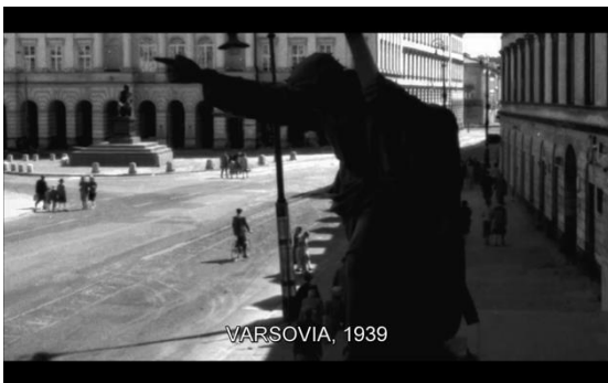
Fig.3.2: Imagen del Nazareno 3