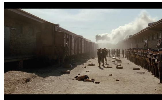
Fig.4: El tren como operador escenográfico-psicológico