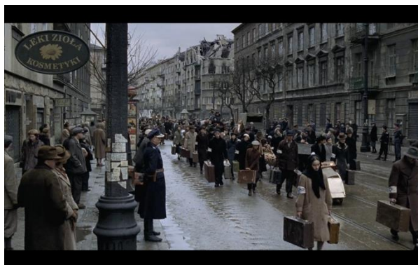
Fig.7: Fase 2 de claustrofobia visual: Normas de la acera

El siguiente factor visual a subrayar sería el vestuario, pues justo a continuación de esa secuencia, se da la orden de llevar la famosa “estrella de David” de cinco puntas en el brazo para distinguir a los judíos del resto de alemanes, logrando un nuevo nivel de aislamiento, esta vez entre las propias personas que cohabitan en la ciudad de Varsovia. Tras la secuencia en que conocemos la orden de llevar el parche con la estrella, vemos al padre de Wlad siendo aislado por unos soldados alemanes de la propia acera, viéndose obligado a utilizar la calzada. Así, el film muestra otro modo de enclaustramiento, ya que se “modifica” sensiblemente el uso urbanístico de Varsovia, o al menos para los judíos que deben circular por el medio de la carretera (Fig.7).