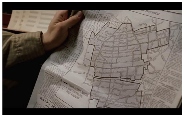
Fig.8: Fase 3 de claustrofobia visual. Plano del Ghetto

El primer retrato u esbozo de esta poética de lo claustrofóbico se sugiere en la imagen del plano de la calle judía en el periódico, calle donde quedarán recluidos en una escena del film. La zona judía se ve subrayada visualmente por esa delineación negrita en dos segmentos, que la aísla del resto del plano del periódico. Esta muestra visual (Fig.8) del proceso de enclaustramiento se acentúa gracias al diálogo en la misma escena acerca de la imposibilidad de introducir a todos los judíos en el entorno, al tratarse de más de 400.000 personas.