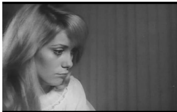
Fig.10: Detalle de la decoración de las paredes en Repulsión

La proposición visual de los barrotes de cárcel, coincide curiosamente con la secuencia de la “estrella de David” antes mencionada. Finalmente, justo cuando llegan a su nuevo No-Hogar , aparece en frente de la ventana la