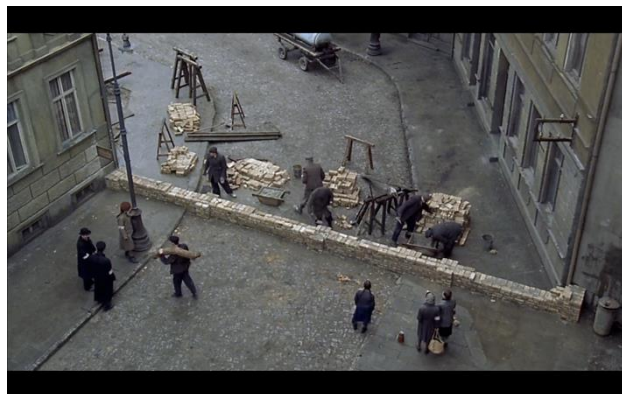
Fig. 11 Fase 4 de claustrofobia visual: la construcción del muro

construcción de un muro que cierra por completo sus calles de las del resto (Fig. 12). He aquí cómo el dispositivo escenográfico-psicológico nos ha “guiado” por la evolución y creación del Ghetto de Varsovia, donde acontecerán gran parte de las secuencias que componen El pianista . No nos referimos exactamente a una construcción propiamente dicha –aunque sí vemos cómo colocan los cimientos- sino a una construcción mediante el juego de elementos escenográfico del film.