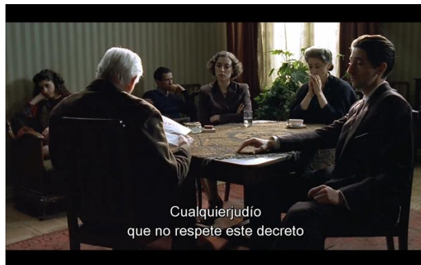
Fig.9: Detalle de la decoración de las paredes en El Pianista

visualización de los barrotes de una jaula (Fig.9). Curiosamente esta operación escenográfica se da en el momento en que reciben la noticia sobre la colocación del emblema de la “estrella de David”. Esta lectura escenográfica ya se apreciaba también en Repulsión , en un momento en el que la protagonista, Carole (Catherine Deneuve), queda recluida en el apartamento presa de sus propios desequilibrios psicológicos (Fig.10) y el fondo que rodea su rostro son unas líneas verticales de decoración, similares a las de esta escena. En el mismo film, cuando el personaje de Colin (John Fraser) se presentaba visualmente encuadrado entre los barrotes de la ventana de un bar, se pronosticaba su futura muerte.