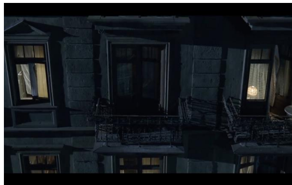
Fig. 5: Escenario de las ventanas

En otra secuencia, la familia Spilzman se muda a una nueva vivienda que también parece responder a la denominación de No-Hogar . En la misma secuencia, este operador escenográfico parece ser el único testigo “visual” de un hecho violento. “Visual” alude aquí exactamente al punto de vista del protagonista, pero sobre todo a cómo la escenografía contribuye a subrayar su lugar como civil indefenso 10 en esta historia. Hablamos, pues, de la secuencia en la que los nazis irrumpen en el bloque de apartamentos que queda justo enfrente de la familia Spilzman. La escena está rodada en un plano picado que luego va ascendiendo verticalmente hasta dar paso a un plano general de una de las habitaciones del edificio. Vemos la situación a través de los edificios y comprendemos del avance de los nazis desde el habitáculo por medio del encendido constante de luces en las ventanas (Fig.5). No se opta por mostrar el avance explícito de los mismos por la escalera del edificio. Hablamos aquí de cierta pérdida de identidad del habitáculo debido a que los inquilinos del lugar, los que hacen que esos apartamentos sean un hogar propiamente dicho, uno de ellos parálítico, son expulsados de sus viviendas para luego ser asesinados. Este desalojo de los habitantes del hogar es lo que convierte este habitáculo en un ejemplo de No-Hogar .