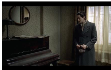
Fig.2 El hallazgo del piano en el apartamento