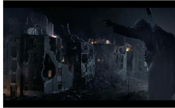
Fig.3.1: Imagen del Nazareno 2